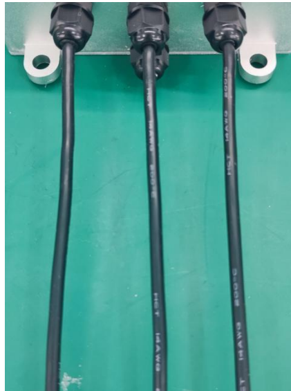
图 2 电调三相输出线

2.1 电调三相输出线：上图 2 中 3 条黑色 14AWG 的硅胶线是连接直流无刷电机的三相输出线。