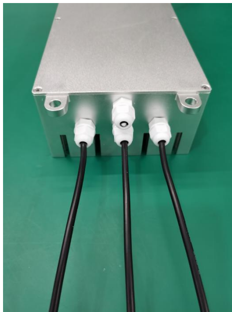
图 2 电调三相输出线

2.1 电调三相输出线：上图 2 中 3 条黑色 12AWG 的硅胶线是连接直流无刷电机的三相输出线。