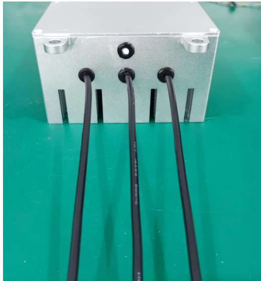
图 2 电调三相输出线

2.1 电调三相输出线：上图 2 中 3 条黑色 14AWG 的硅胶线是连接直流无刷电机的三相输出线。